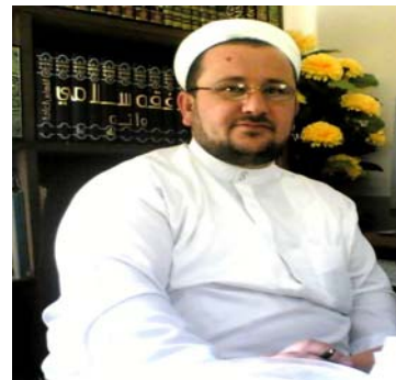
ده کهن، که ته مه ده بیته گه وه درترین ده سکوت بۆمان.

هه مر له و باره وه مامۆستا مه لا ئیحسان ده وکی په یقی خۆی به م شیه وه ده بی: له و یاده دا ده خوازم مامۆستایانی ئایینی به رۆحیه تیکي تازه وه روو بکه نه یه کیتی زانایان به هه موو لایه ک بنوانین به ره و پشوه ی به رین، چونکه له کورده ستان هه موو ریکخواه کان کار له پیئا سه رخستنی کارو پرۆه یان ده کهن وه هه ولی ده سکوت ده دن، ئیمه ش ئه گه ر هاوکاری یه کتر بین ئه وه وه ک چون یه کیتی زانایان فه خر به رابردوی خۆی ده کات به هه مان شیه وه ئه وه ی دوی ئیمه ش فه خر به ئیمه وه