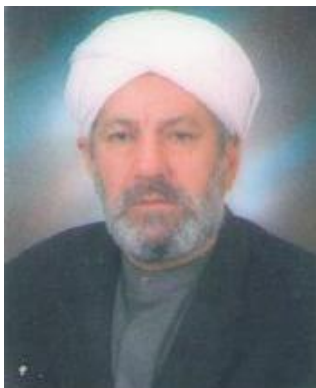
هه مر له و باره وه به ریژ دکتر شیخ ئه حمه د بالیسانی گوئی: یساده کورده وه ی هه ر هه نگاویکی رابوو، بو ئه وه یه مرۆ وانه و په ندی ئی وه ریگرو ئاییندی له سه ر باشر بکات، زانایان نه ک هه ر له ناو کاری ریکخواه یی به لکو به درتیزی ته مه نی میللهتی کورد خه باتیان کورده و، شه و خونی زۆریان چه شتوه له پیئا و نیسلا و خزمهت کورنی موسلمانان، ئیمه له میژوی رابردوی نه ته وه که ماندا ئه گه ر میژوی زانایانی ئی بکه یینه وه شیتکی ئه و تر نامینیتته وه، له بهر ته وه ده بی له و قوناغه شدا به هه مان شیه و زانایان له سه ر ریپازی سه لفی صالحو خزمهت کورنی ئیسلام برۆن، چونکه میرانگری پیغه مبه رن، له سه ر قوناغیکیش ئه رکی سه رکی عوله مای ئایینی ته وه یه، وه بسانگخوازو دلسوژیکی ئه مر نیسلا مه تیپکۆشی و خزمهتی نه ته وه و ولاتی خۆی

دینداری دانه بری و گه له که مان تووشی دوره دینسی نه بیټ، له گه ل ته وشدا ئه رکه مامۆستایانی ئایینی لیک نریک بسو بۆچوونیان ئالوگۆر کهن، تا له ته نجامدا په ریژی حیوارو ده ریپنی زانستی دروست به ی، چونکه له په یامی ئیسلامدا هیلک هه یه هانان ده دات، بو یه کترتو پیکه وه بوین له پیئا و گه یشته ناما ئه کاغان، چ جایی له کاری ریکخواه یی که کاری ده سته جمعی و هۆشیاری بوونه ی مه سه له هه ستیاره کانه. مامۆستا مه لا سه بهار که لاری پیی واپوو: ئه و یاده هینده له بهر ته ره گرنگه، چونکه هه له سه نگانن بو کارو پرۆه هه نگاوه کانی رابردو ده کړی، بو ئه وه ی بزاسنی، له کام لایه وه که م کوری هه یه چاره سه ر بکری، له کام لاش تواره په ری زیاتری بی بدریت.