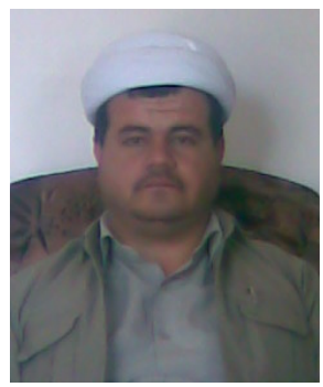
مه لا زیاد حسن نازگی

زانایانی ئایینی و کارو چالاکیه کان به گشتی بۆی زۆر جار گه لیه ی هه بووه و که م و کوری هه بو، به ده مه وه چوینی زانایانی ئایینی له ناستیکي لاواز بووه، کارو چالاکی به گویری پیوست نه وه به لام نابی ته راستیه له یساده بکه یین که بارو ده خۆکی سیاسی ناهه موار له کورده ستان دروست بوو نامانه ویت برینی هیچ کس و لایه نیک نوی بکه یینه وه بۆیه ئه و بارو ده خۆه زۆر کیشوه گرفت ی بو هه ر تاکیک و کۆمه لگا به گشتی دروست کرد یه کیتی زانایانی ئایینی ئیسلامیش بی به ش نه بو له م گرفتانه وه نه ئی که م و کوری سه ریانه هه لدا به لام له گه ل هه موو بارو ده خۆکان یه کیتی زانایان له زۆری کیشنه کان یه که هه لوتیست بوون و قه د بریاری دای یه کتریان نه داوه و هه میشه ته نسیق هه بو له نیواناندا بۆیه ده بیین له گۆنگه ری پیئجه می خۆیدا سوپاس بو خوا