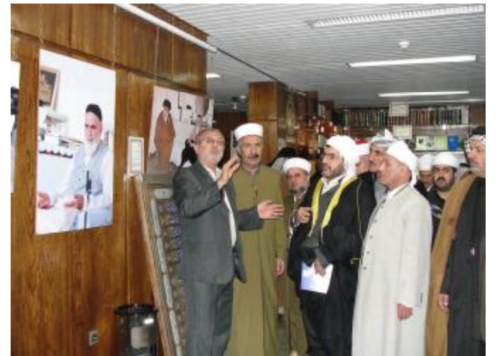
شوێنی گرنگو میژوویی و شارستانی و فەرھەنگی لەخۆیان دەگرن.

لەسەرژۆانی ۱۸-۲۶/۱۲/۲۰۱۰ شاندی زانایان لەوڵاتی ئێران مانەووە، لەسەرەتاشەو لەلایەن دامەزرەووی فەرھەنگی ئیمام خومەینی پێشوازیکران، کە دامەزرەویەکی گرنگو تاییبەت بۆ پەرەپێدانی کاری رۆشنیبری و چالاکای دیپلۆماسی دامەزرەووە، چەندین لقی لەو وڵاتە هەبوو، بە چەندین شیوازی پەيامی خوێ دەگەینیت. ئەوان بەسەردانی زانایانی هەریمی کوردستان زۆر خوشحالی بوونو خزمەتیکی باشیشیان کردن، هەر لە یەكەم رۆژەو تا کاتی گەراوە ئەوان سەرپەرشتی دەرچوونەکانیان دەکردو بەرنامە یۆژانەیان بەرپێو دەبرد. ئەو گەشتە سێ پارێزگای گرتەو، لە پێشدا تاران پایتەخت و پارێزگاری مەشھەد و پارێزگای قوم، کە چەندین