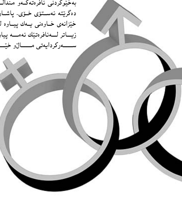
Chronicle / Rick Nobles

سەیرەکەى ئەم خانە بەریزه، واتە ئەگەر بیست و نافرەت زیاتر لەپیاویكى هەبیت ئەمە لەگەڵ ئەم مافانەى باسان کردکە لەسەر پیاو پیوست چۆن دەگوختیت؟. واتە چۆن ژن پتیی دەکریت میردەکانى و مندالەکانیان بەختوبکات؟! هەرۆه چۆن دەتوانی ئارهزوه جنسییه کانی هاوسەرەکانی تیر بکات؟ بەتایبەتە لەکاتی کاتدا هەموومان دەزانین نافرەتەن توشى سەیرەکەى ئەم خانە بەریزه، واتە ئەگەر بیست و نافرەت زیاتر لەپیاویكى هەبیت ئەمە لەگەڵ ئەم مافانەى باسان کردکە لەسەر پیاو پیوست چۆن دەگوختیت؟. واتە چۆن ژن پتیی دەکریت میردەکانى و مندالەکانیان بەختوبکات؟! هەرۆه چۆن دەتوانی ئارهزوه جنسییه کانی هاوسەرەکانی تیر بکات؟ بەتایبەتە لەکاتی کاتدا هەموومان دەزانین نافرەتەن توشى سەیرەکەى ئەم خانە بەریزه، واتە ئەگەر بیست و نافرەت زیاتر لەپیاویكى هەبیت ئەمە لەگەڵ ئەم مافانەى باسان کردکە لەسەر پیاو پیوست چۆن دەگوختیت؟. واتە چۆن ژن پتیی دەکریت میردەکانى و مندالەکانیان بەختوبکات؟! هەرۆه چۆن دەتوانی ئارهزوه جنسییه کانی هاوسەرەکانی تیر بکات؟ بەتایبەتە لەکاتی کاتدا هەموومان دەزانین نافرەتەن توشى