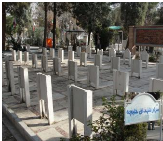
مزار شەهیدای حلبجە

لە پیرانشاریش مەدرەسە مامۆستا محمدی بوداغی کە بە قوتابخانەی سەلامەتین ناسراوه، بەسەر کرایەوه و پەيامی زانست و هەماهەنگی دووپات کرایەوه.