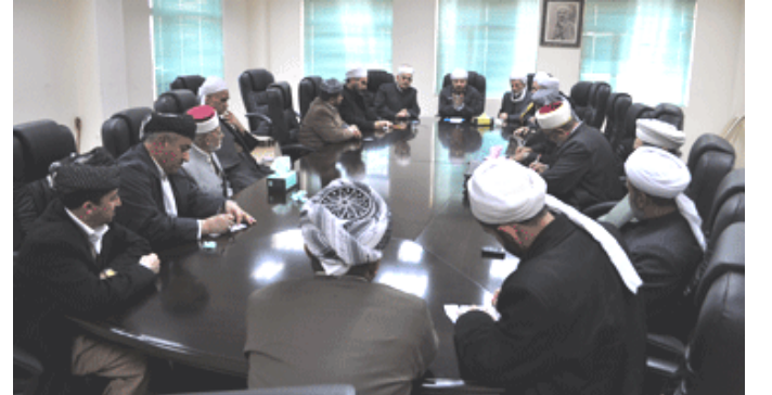
بەرپىزەبەرايەتییەكانى ئەوقاف بكرىت. لەو بارەو بەرپىز مامۆستا جەلال

ھول دەدەن خەلگ و كوردستانى خۆمان لەو خىرو خوشى و بەرەكەتە بى بەش نەكەن.