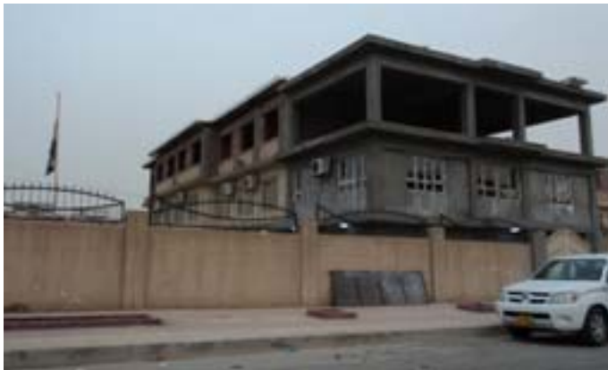
ده‌سته‌ی داواکاری گه‌شتیش به‌هه‌مان شێوه‌ سهردانی قوتابخانه‌ی ناوبروایان کردووه.

لیژنه‌ی بالای فه‌توای کوردستان: حوکمی وه‌رگرتنی پیشینه‌ی خانووبه‌ره‌ روون ده‌کاته‌وه دوای چه‌ندین دانیشتنو دیدار له‌گه‌ڵ لایه‌نه‌ په‌یوه‌ندی‌داره‌کان، رۆژی (۲۰۱۰/۹/۷) مه‌کته‌بی ته‌نفیزی یه‌کیتی زانیانی نایینی نیسلامی کوردستان به‌نوسراوی فه‌رمی داوای له‌ وه‌زاره‌تی دارایی حه‌کومه‌تی هه‌رێمی کوردستان کرد، بۆ ته‌وه‌ی زانیاری ته‌واویان بده‌ن له‌سه‌ر شێوه‌ی دا به‌شکردنی ته‌واو پارهی له‌پیشینه‌ی خانووبه‌ره‌ له‌ هاو‌لاتیبیان وه‌رده‌گیریت. رۆژی (۲۰۱۰/۱۰/۳) وه‌زاره‌تی دارایی به‌ ره‌سی وه‌لامی نوسراوه‌که‌ی یه‌کیتی زانیان دا به‌وه، بۆ روونکردنه‌وه‌ی بایه‌ته‌که‌ رۆژی (۲۰۱۰/۱۰/۷) لیژنه‌ی بالای فه‌توای کوردستان به‌ ناماده‌بوونی سه‌رۆک و جێگری سه‌رۆکی زانیان و سه‌رۆکی لیژنه‌ی ته‌وقاف له‌په‌رله‌مانی کوردستان و چه‌ند مامۆستایه‌کی نایینی له‌هه‌ولیرو سلێمانی و ناوچه‌کانی دیکه‌ی کوردستان، کۆبوونه‌وه، تا له‌کۆتایی لیژنه‌ی بالای فه‌توای کوردستان حوکمی وه‌رگرتنی سوله‌قی عه‌قاری روونکرده‌وه. ده‌قی فه‌توایه‌که‌، له‌لایه‌ره (۵) بچۆینه‌وه.