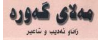
مه‌لای گه‌وره زانو ئه‌دیب و شاعیر

کو‌چی دوا‌یی مام‌وستا مام‌وستای خو‌ناس یا‌ش به‌سه‌ر بر‌دی (۶۳) سا‌ن ته‌مه‌ن له‌خ‌زمه‌تی ئیسلامدا له‌ئیت‌وا‌ری پ‌وژی (۱۲/۹/۱۹۹۶) له‌ نه‌جم نا‌وا کو‌چی دوا‌یی کردوه (۱) . به‌ ته‌مری خوا له‌کاتی نو‌ژی مه‌غریب داو له‌سه‌ر به‌رمان کو‌چی دوا‌یی کردوو، پی‌غه‌مبه‌ریش (h) ده‌فه‌رمو‌ی ﴿من کان آخ‌ر کلامه‌ - لا‌اله‌ الا‌ الله - دخل الجنة﴾ صحیح الجامع (۴۳۲/۵). مسلم . حدیث (۸۲) { ۲۱۰/۱۷ } . (ف‌سلام علیه یوم ولد و یوم مات و یوم یبعث حیاً) . * به‌ی‌زنه‌ی کو‌چی دوا‌یی مام‌وستا‌ره زۆر له‌شاعران مه‌رسیه‌یان ب‌و گ‌ن‌راوه، ئیستا ل‌یره‌دا مه‌رسیه‌ی شاعیری گه‌وره‌ی