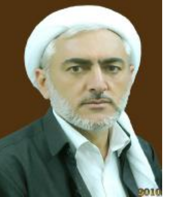
مەلا نە ھەدى قامىشى

مۆدىلى باۋى نەم سەردەمە گىرنكى دانە بەرۋەكەش ۋە دىكۆرۋر خۇدەرخست بى گۇيدانە ناخ ۋە ناۋەرۆك! كە بەزاراۋە نەمۆ پىسى دەلەن (فۇرمالىزم) واتە: تۋىكىلى بى كاكل ۋە ناۋى بى ناۋەرۆك، چۆنكە نەۋانە بىز خۇيان نازىن ۋە بۇرازىكردنى خەلك دەۋىن! نەۋەش مەزۇۋە دەكاتە كەسىكى دوورۋو ھەلپەرستو بىبىسارۋارو خۇسار، كىردارو كوفتارى جىاۋزەو كەسىتى ۋە ناسنامەى لەدەست دەدات، نەم دىبارەبەش مەتارىيالىزم، بىگومان ناۋ ھىچ لە ناۋەرۆك تاكۆرپت، ۋەك پىشيان ۋە تۋىبانە (بەھلوا ھەلوا دەو شىرىن نابى) كەسى فاسق بىت ناۋى بىنى صالح بەۋەچاڪ نابى، بەداحەۋە كارىگەرى نەم پەتايە بەھۋى دوركە تەنەو لە پابەندى دىنەكەيان تىگەبىشتى چەۋاشە زۆرپىك لە مۇسلمانانىشى گرتتەۋە! لەۋرۋەكەشدا زانايە بەلام نەزانە، پىگەبىشتە بەلام تىنەگەبىشتە، ناۋى سەھەفەۋ شۋىنەكەۋتەمى سەھەف نىبەناۋى لەخۇى ناۋە صۆفى بەلام لەگەن مۇسلمانان صافر پاك نىبە! ناۋى مجاھىدە بەلام جىھاد ناكات ئىناۋى شەرىفەو شەرىف نىبە، دەلى سەھىد بەلام لەرىيىزى گەورەكى ناۋوات! ۋەتەنە نەم شتەنى كە صىنى ۋە عادىە بەلام نىشانەى يابانى لىندراۋە بەرەش چاڪ ناپىست ھەر تەزۋىر، تاكەچارەسەرىش نەۋەبەكە لە ناخەۋە دەست پىنەكەين، لەرىگەى