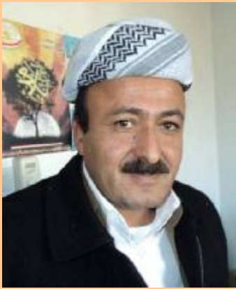
مەلا رسول گەردى