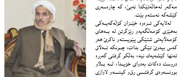
سەرۆكى لىژنەى بالى ھەتوا: ھۆكارى سەرەكى جىابوونەوى ژنو پىاىو لەبەرەكتر مەسەلەى ئابوورىيە

زانايانى دەروونناس لەبارەى كارىگەرە دەروونىيەكان لەكاتى جىابوونەو دەدەين ھەروەك بەرپىز دكتۆر (سىروان) پىسپۆرى دەروونناس لەو بارەو گوتى: يەك لەو ھۆكارە پائوانەى، كە زۆرىك لە گەل كۆمەلگەكانى بەرەو دواو بەردو، مەسەلەى جىابوونەو، بەتايبەت جىابوونەوى خىزان و ھەلەو شەنەو پىرەسەى ھاسەرەگىرى، لەبەر ئەو ئىسلام لەگەل تەلەق نىبە مەگەر لەھالەتەكىدا نەبى، كە چارەسەرى كىشەكە ئەستەم بىت.