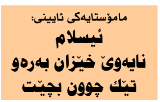
مامۇستايەكى ئاينى: ئىسلام نايەوى خىزان بەرەو تىك چوون بچىت

بەلام ئەوى لەنەتواناندا زۆر بەزەقى دەبىندى كىشەى تەلەق بەداخوھە سالانە ئەم رىژەيە زىاد دەبىت، كە ئەمە كارىكى زۆرئىكە تىقى دەبىت ئەوانەى بەمەبەستى تەلەق دىنە لاي ئىمە، ئىمە وەكو لىژنەى ھەتوا زۆر دلتەنگىن لەو ھالەتە، پىمان واپە دەبى ھەموولا لەسەر ئەو كۆك بىن، كە چارەسەرتىك بۆ ئەو ديارەدە دابنەين، ئەو كىشەنەى دىنە لاي ئىمە فائىليان بۆ دەكەينەو دە نامۆزگارىيان دەكەين، بەلكو لەو ھەنگاويان پەشيمان بىنەو، جا ئەگەر ھەر پەشيمان نەبوونەو، ئەو ئەم بەبىتى شەرخ، كارى پىتويستيان بۆ دەكەين و روانگەى شەرخيان لەو بابەتە بۆ روون دەكەينەو، بۆيە ھەر لىرەو داوا لەھەموو مۇسلمانان دەكەم كەھەتەى وانەكەن و تەلەق بەسەر زوبانمان دانەھىت. ناوبراو گوتىشى: جارى وا ھەيە ئەفەرى و اھاوتوو لەسەر شتى زۆر سادە