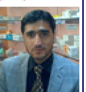
هه ردي نهه وه ر

نا فره ته كه رو و دا وه كه ي بؤ مي ته ده كه ي با س كره و مي ته ده كه ي شي بهه خو شحالي ه وه وت ي: با سه دهه له مه مند (سپرت) ه بي نيه سه ژو رو وه ماله كه مان پر كه ين له سه رو وه و سامان. بهه لام نا فره ته كه بهه پيچه وانه و وت ي: بؤ سه ره كه وتن دهعه و ته نهه كين. لهه م به ينا كه يه كه يان كه نا كا داري با بهه ته كه بو و ت ي: بؤ خو شه ويسه تي (عشق) ه دهعه و ته نهه كين و ماله كه مان پرس كه ين لهه خو شه ويسه تي؟ پاشا ن پي وا ده كه ي ته ما شا يه كي ژنه كه ي كره و وت ي: برؤ بانگي خو شه ويسه تي (عشق) ه كهه با بهه سه ي كه يه كه مان ب كه ين. پاشا ن نا فره ته كه زو شت بؤ لاي پير مي ته ده كان وت ي: كا مه تان خو شه ويسه تي (عشق) ه؟