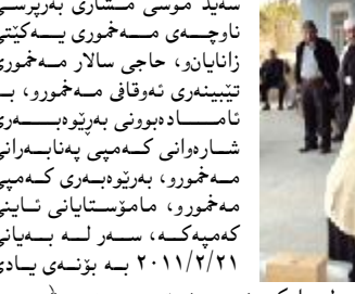
مه لا سید صدیق که پرانی، راگه یانندن لقی هه ولیر: سه رله به یانی روژی چوارشه مه ۲۰۱۱/۲/۹ شانديکي لقی شه قلاوه ی په کیټي زانايان، که پتیکه اتوو له بهر پیژان ماموستا مه لا ته حسین بهر پیرسی لق و، ماموستا مه لا عوسمان لاسه ی و، ماموستا مه لا عه بدوهادی شیخ و هسانی و، ماموستا مه لا یونس باویانی کارگریانی لق و، ماموستا مه لا سولیمان گه ره هه بی بهر پیرسی ناوچه ی شه قلاوه و، ماموستا عه بدو له موز نه دمانی لیژنه ی هفتا سهردانی راگریه تی

سینغقراوانی زیسارتی پیساوانی پؤلیسی ها توچویان بهرامه ر به شو فیزان و هارلایان گرنگ و هسف کردو، باسیان له گرنگی هه بوونی نارامی و ته بایی زیتری ناوچه که کردو، له بهرامه ریشدا بهر پیوه براتی نادبواو سویاسی زانایانی کردو، به لایه ناسانکاری و سینغقراوانی خویشتانان دوپا تکرده ووه له بهرامه ر گله یی و گازنده ی هارلایان.