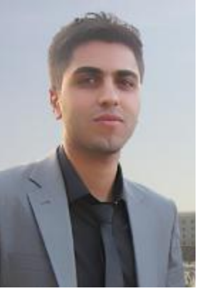
نا. دنزار نه مین ساح